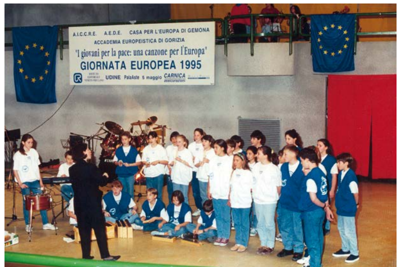
1995 Celebrazione della giornata europea al palasport di Udine