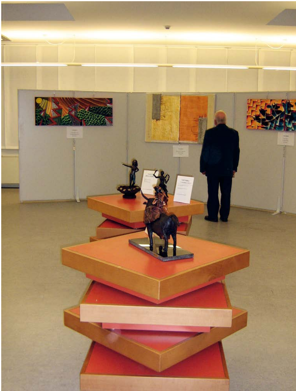
Opere esposte al Museo Carnico delle Arti Popolari a Tolmezzo

prima tappa ha toccato Klagenfurt, nel mese di maggio, in occasione della “giornata d’Europa”, l’esposizione si è tenuta a Gradisca d’Isonzo. Successivamente il percorso si è snodato da Lubiana a Malborghetto per concludersi a Tolmezzo. Ogni evento si è svolto in prestigiosi ambienti di rappresentanza o museali e con una notevole partecipazione di autorità e pubblico. Sono stati distribuiti 400 cataloghi trilingue (italiano, sloveno e tedesco) che hanno accompagnato la mostra in ogni località ospitante. Alla base di questo successo c’è senza dubbio l’impegno e la ricerca degli artisti, tutti molto attivi e partecipi di questo progetto, tutti cittadini italiani, austriaci e sloveni dell’Euroregione Alpe Adria. Essi hanno saputo presentare non solo alcune interpretazioni del mitico ratto d’Europa, ma anche rappresentare i più recenti passaggi della storia europea legati