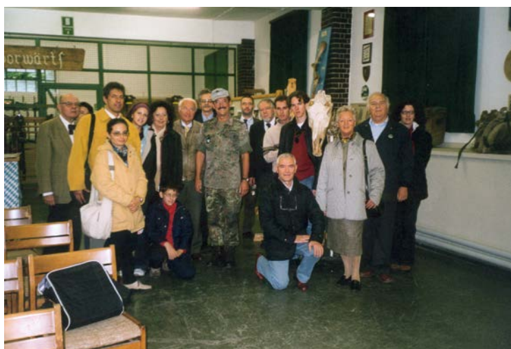
2003 Visita alla Brigata Alpina a Bad Reichenhall organizzata con l'associazione tedesca "Europa Union"