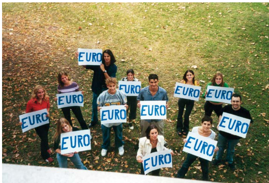
2001 Il team "Euro" dei giovani dell'Accademia Europeista per l'informazione sul nuovo sistema monetario