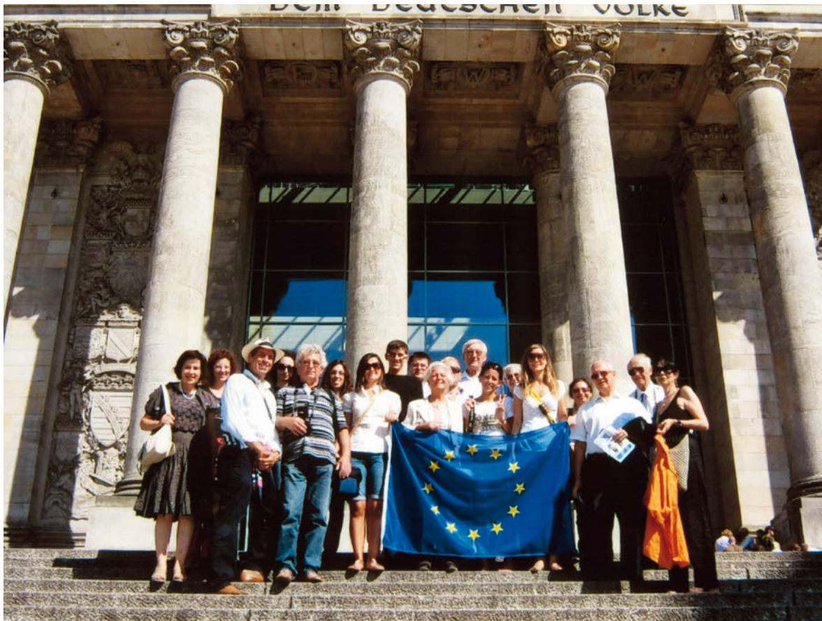
La delegazione dell'Accademia Europeista davanti al Reichstag, agosto 2009