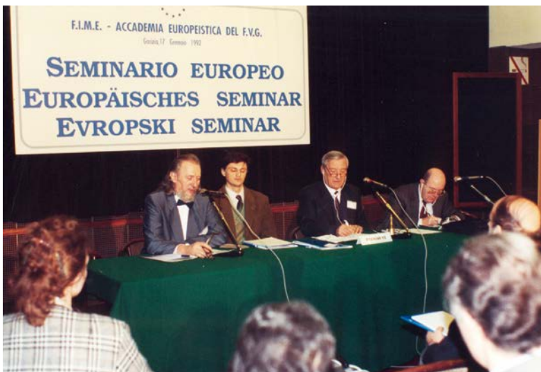
1992 Primo seminario europeo internazionale al Kulturni Dom di Gorizia